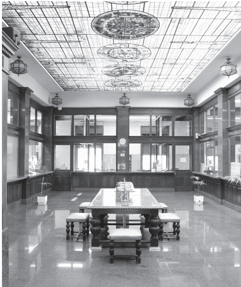
Patio de operaciones.

La fachada principal da a la calle Viera y Clavijo, lindando a su derecha con la Subdelegación del Gobierno, a la izquierda con la calle General Antequera y, en su parte trasera, con la calle Pi y Margall.