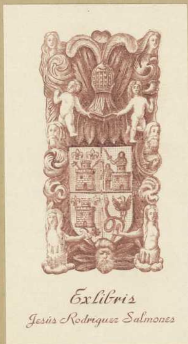
Ex libris Jesús Rodríguez Salmones

UNION LITERARIA, calle de San Francisco y del General Riego n.º 30. CADIZ.