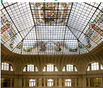
Vidriera del Patio de Operaciones.