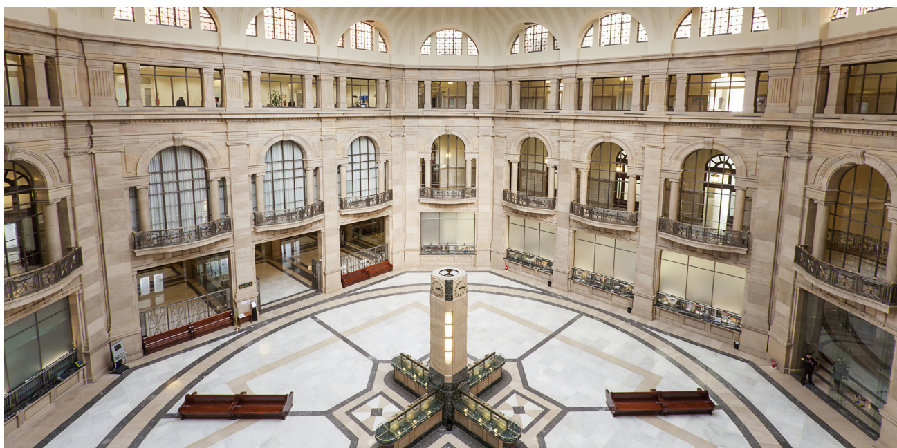
Patio de Operaciones.

En el caso de la Dirección General de Efectivo y Sucursales, para los nuevos acuerdos, se ha definido un campo de colaboración amplio: fabricación, emisión de billetes, puesta en circulación de monedas y lucha contra la falsificación, tratando de ser más exhaustivos que en convenios anteriores.