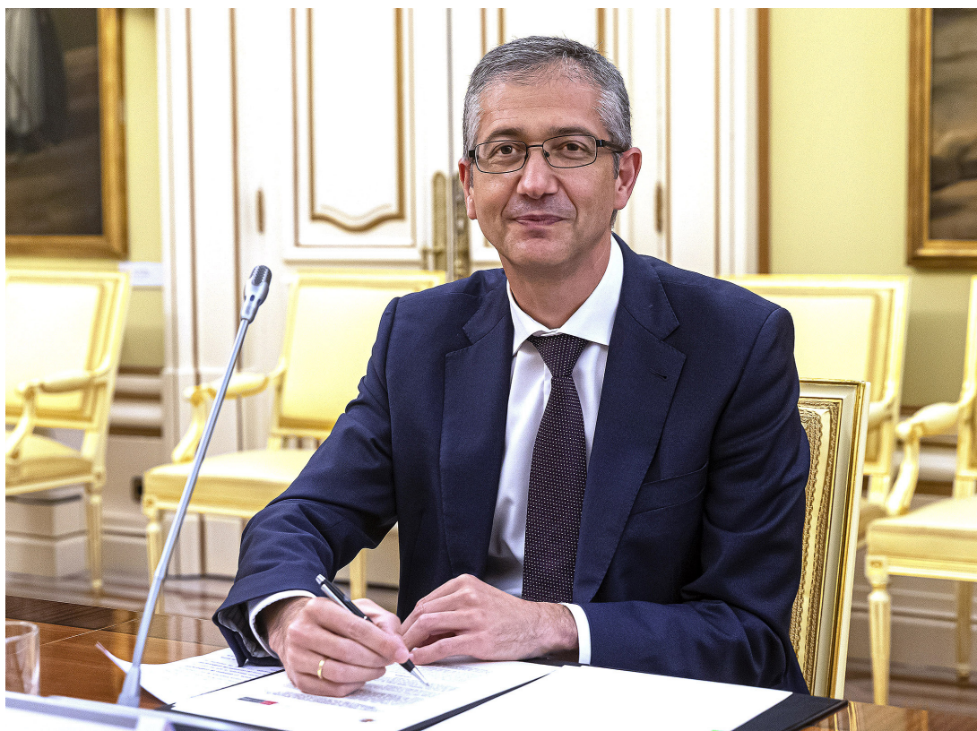
Pablo Hernández de Cos, Gobernador del Banco de España.

Los Memorandos de Entendimiento son herramientas muy útiles para consolidar y potenciar las relaciones de cooperación con instituciones con las que se comparten objetivos e intereses. En la actualidad están vigentes doce acuerdos, de los cuales tres se han firmado en 2020. En línea con una de las iniciativas del Plan Estratégico 2024, que persigue alcanzar el posicionamiento del Banco de España como banco central de referencia en América Latina, estos tres acuerdos se han firmado con instituciones de la región. Como consecuencia de las restricciones a la movilidad derivadas de la pandemia, en ninguno de estos tres acuerdos se ha celebrado un acto formal de firma con la participación de nuestro Gobernador y del Presidente de la otra institución.