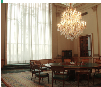
Sala de la Comisión Ejecutiva.