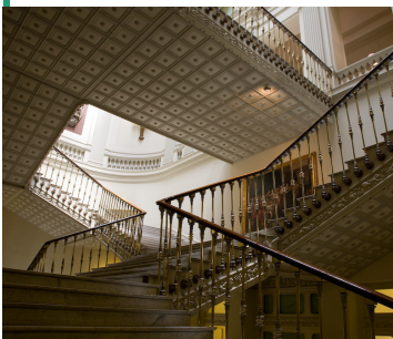
Escalera del Gobernador.