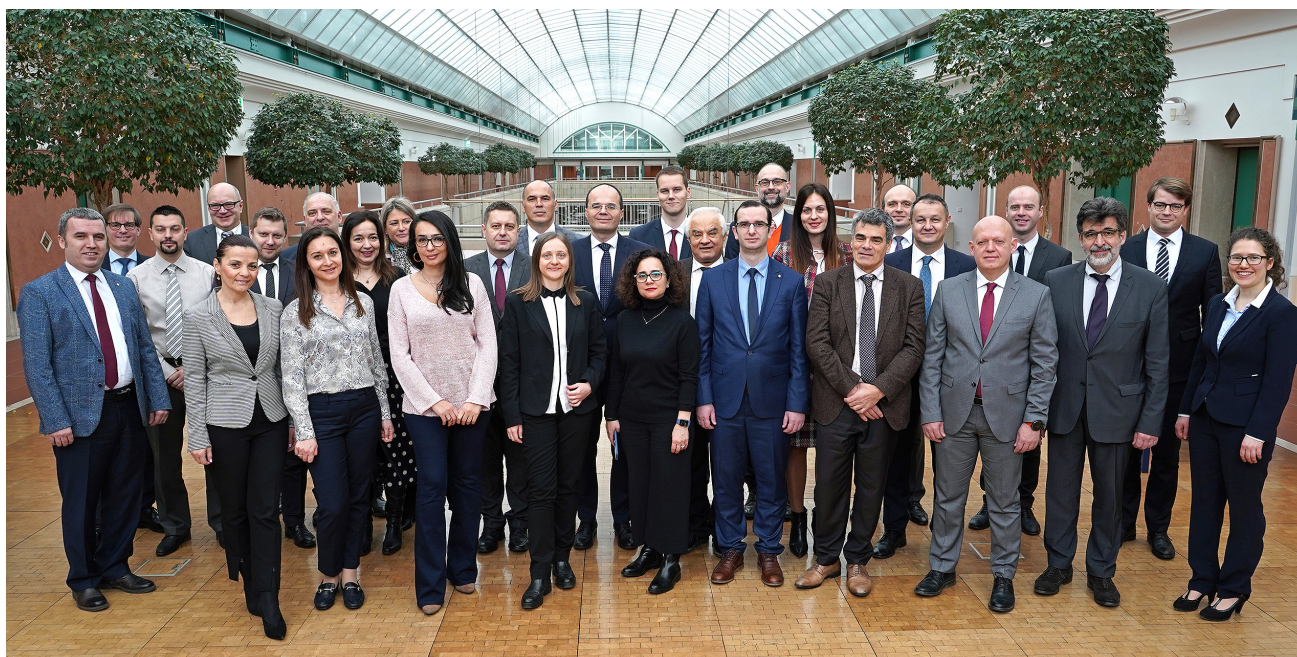
Foto de Grupo de la reunión High Level Policy Workshop on Non performing Loans celebrado en Frankfurt.

Tal y como informamos en la primera edición, en marzo de 2019 el Banco de España se embarcó —junto a otros 20 bancos centrales del SEBC y al BCE— en el Programme for Strengthening the Central Bank Capacities in the Western Balkans with a view to the integration to the European System of Central Banks , un programa de dos años de duración financiado por la Comisión Europea y dirigido al fortalecimiento de las capacidades institucionales de los bancos centrales y agencias de supervisión de los Balcanes Occidentales.