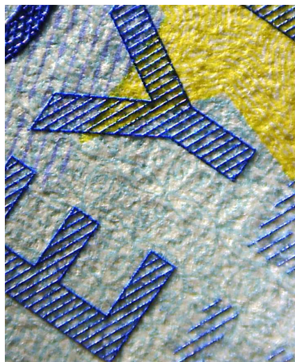
Detalle de una calcografía.

La crisis sanitaria mundial provocada por el COVID-19 ha supuesto un notable cambio en la manera de desarrollar las diferentes iniciativas de cooperación internacional. En 2020, el número total de actividades atendidas desde la Dirección General de Efectivo y Sucursales fue similar al de años precedentes y, aunque las restricciones impuestas a los desplazamientos fueron causa del aplazamiento de algunas de ellas –Reunión de Tesoreros de Banca Central, Reunión de Expertos en Atención a la Falsificación–, otras fueron reprogramadas para celebrarse de forma telemática –Taller de Proyectos de Innovaciones sobre Efectivo–,