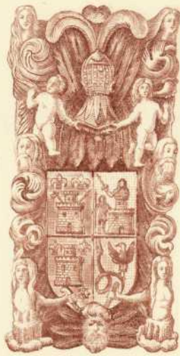
Ex libris Jesús Rodríguez Salmones