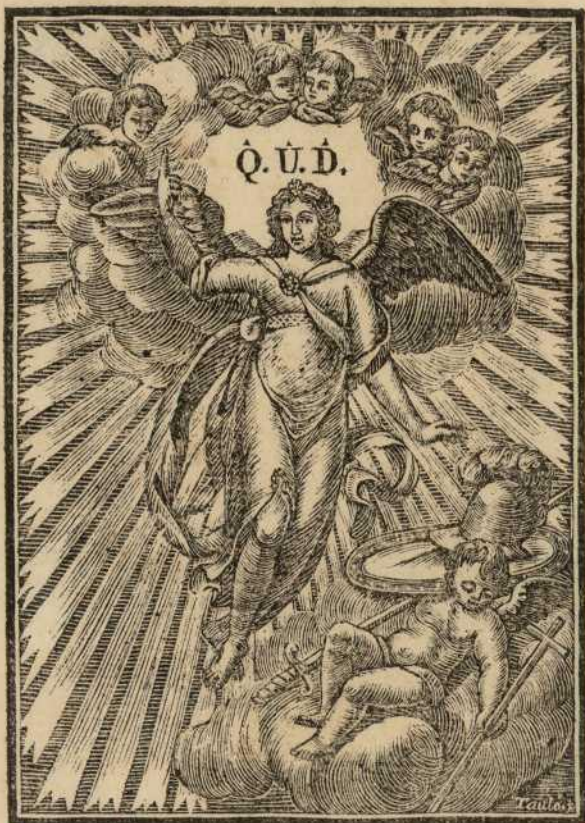
IMATGE DEL ARCANGEL SANT MIQUEL, que se venera en la Capella de Tenders Reve- nedors, collocada en la Iglesia Parroquial de nostra Señora del Pí de la Ciutat de Barcelona.