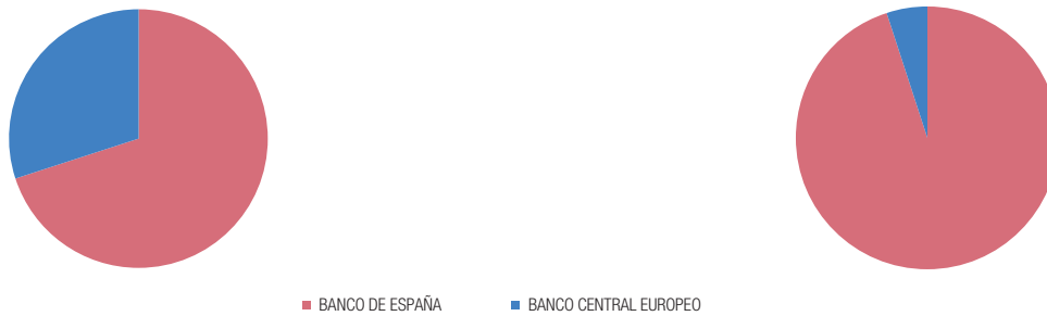
2 INSPECCIONES IN SITU